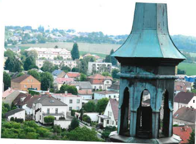
Historicko-vlastivědná procházka, pohled z kostelní věže.