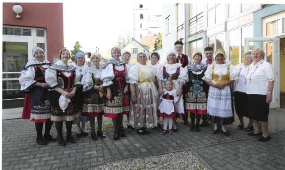
Baráčníci Sobotka – návštěva České televize