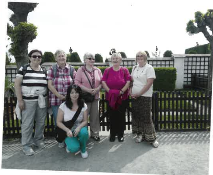
Výlet studentů VU3V do Lán