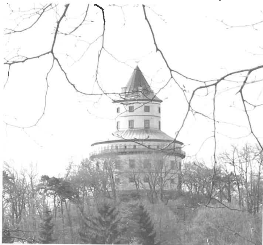
Humprecht – foto: R. Vokounová