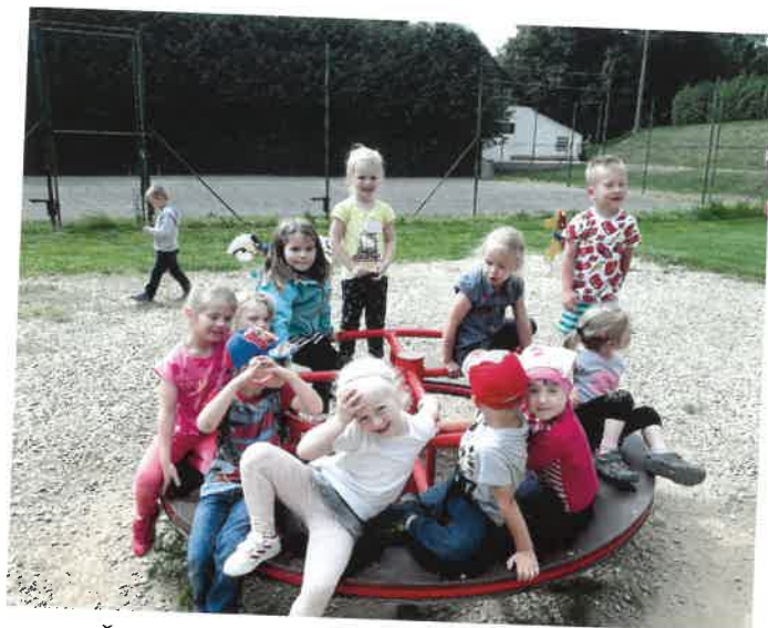
MŠ Sobotka – výlet do ZOO Chleby – foto: H. Reslová