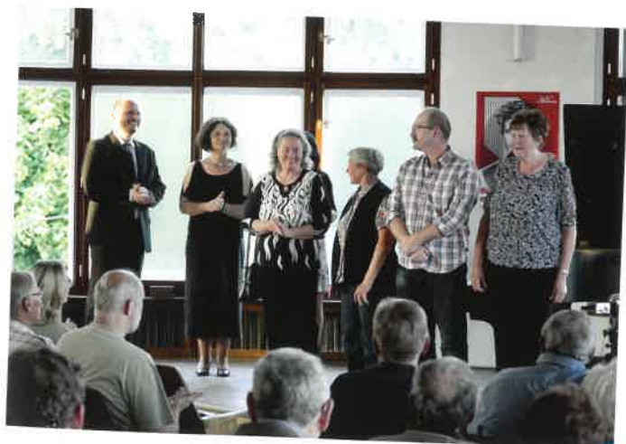
Modrá krev Sobotecka – slavnostní závěrečný večer, foto: R. Vokounová