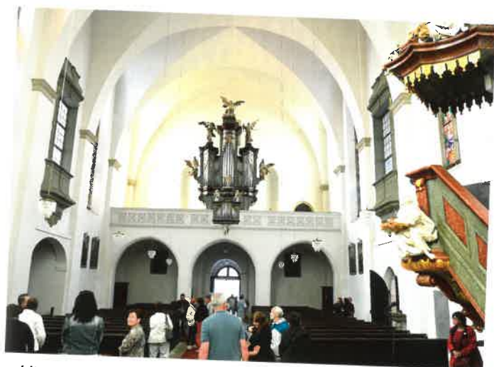
Historicko-vlastivědná procházka – kostel sv. Máří Magdaleny