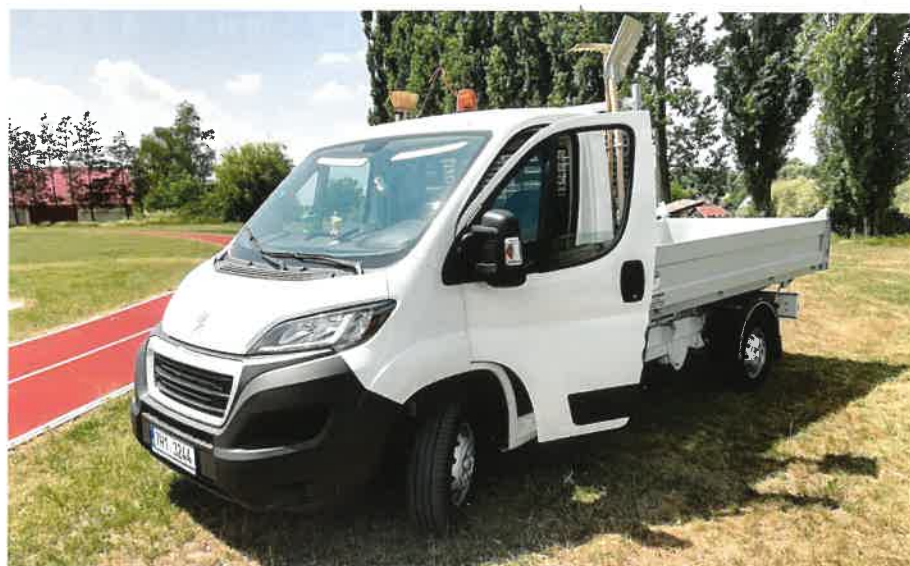
Nové užiték vozidlo Peugeot se sklápěcí nástavbou